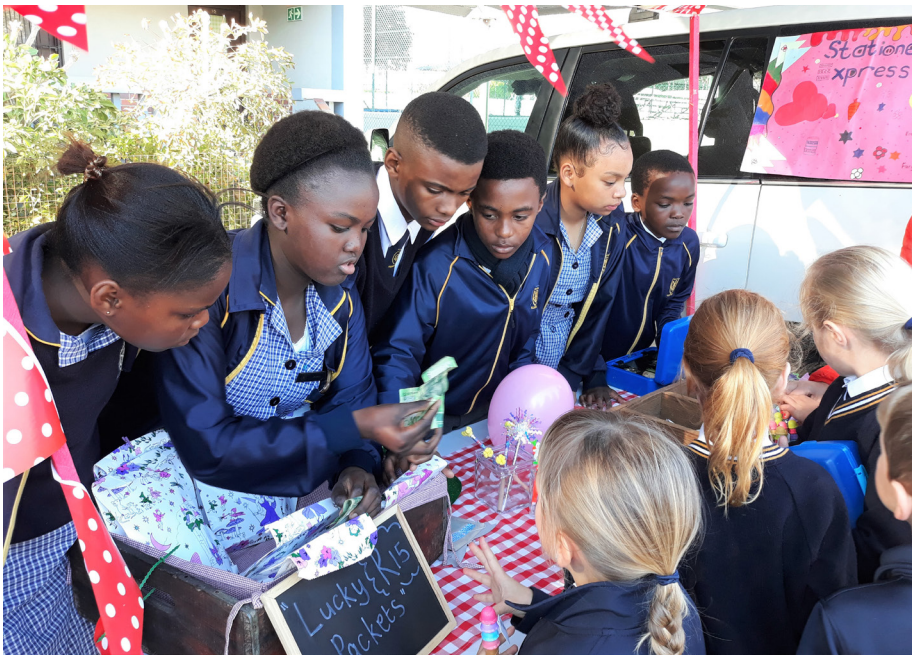
Die Jannies staan tou om besigheid te doen met die leerders van Ellerton Primary.

Heel links: By Ellerton se mini gholfbaan kon jy met 'n kolskoot groot note web. Links: Met lekker eetgoed het Ellerton ons mae en hul skool se beursies volgemaak.