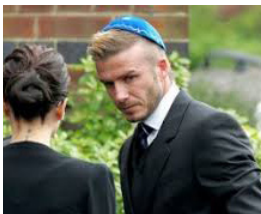
Die gewese sokkerspeler, David Beckham, sien homself as 'n Jood. Hier dra hy 'n kippah.

Judaïsme (of Jodendom) is die godsdienst van die Jode met oor 15 miljoen volgelinge