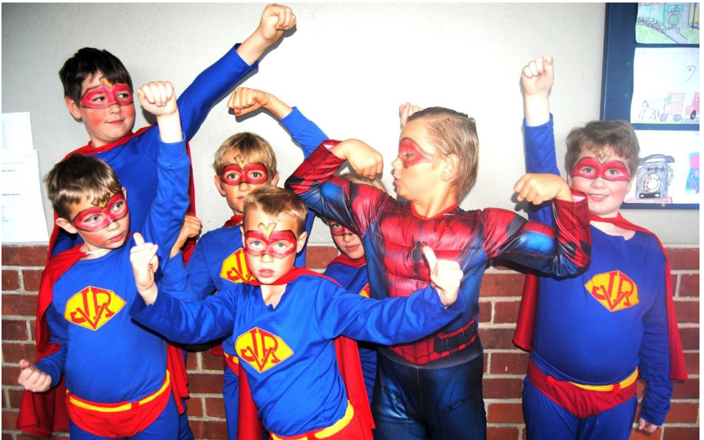
JvR se Gr.3-superhelde wys hulle spiere.

Hierdie konsert is opgedra aan mnr. Oosthuizen wat vir die laaste keer as skoolhoof die konsert bygewoon het.